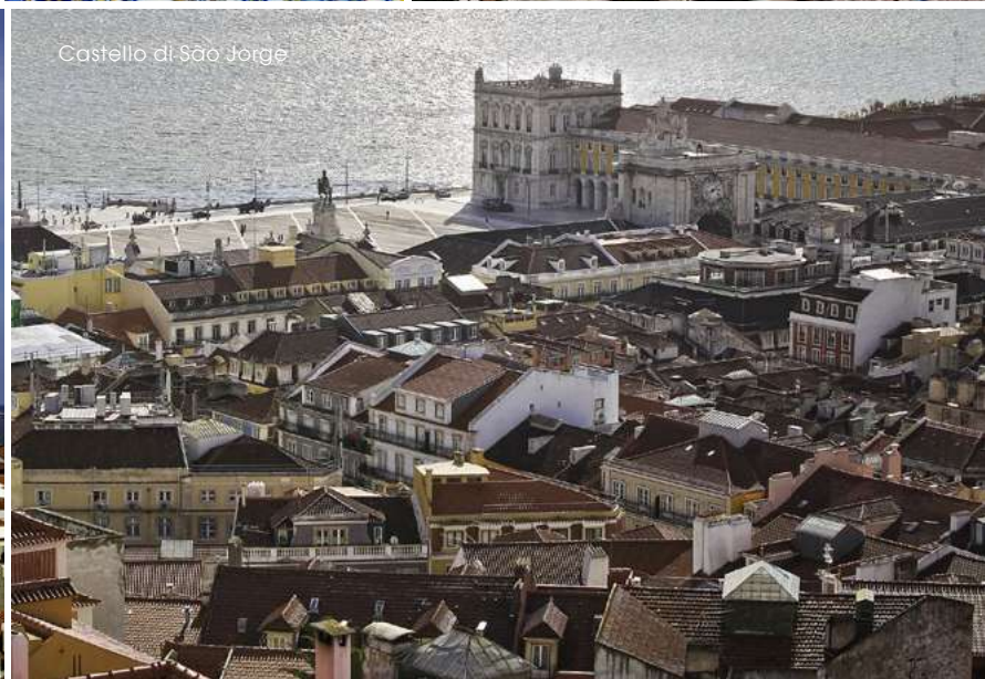
Castello di São Jorge