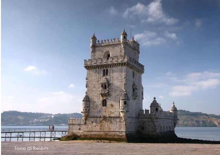
Torre di Belém