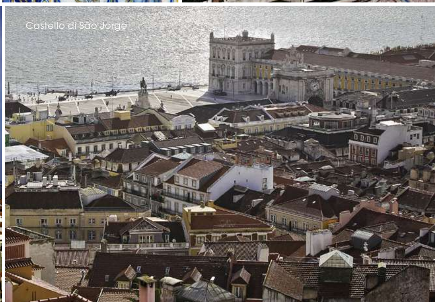
Castello di São Jorge