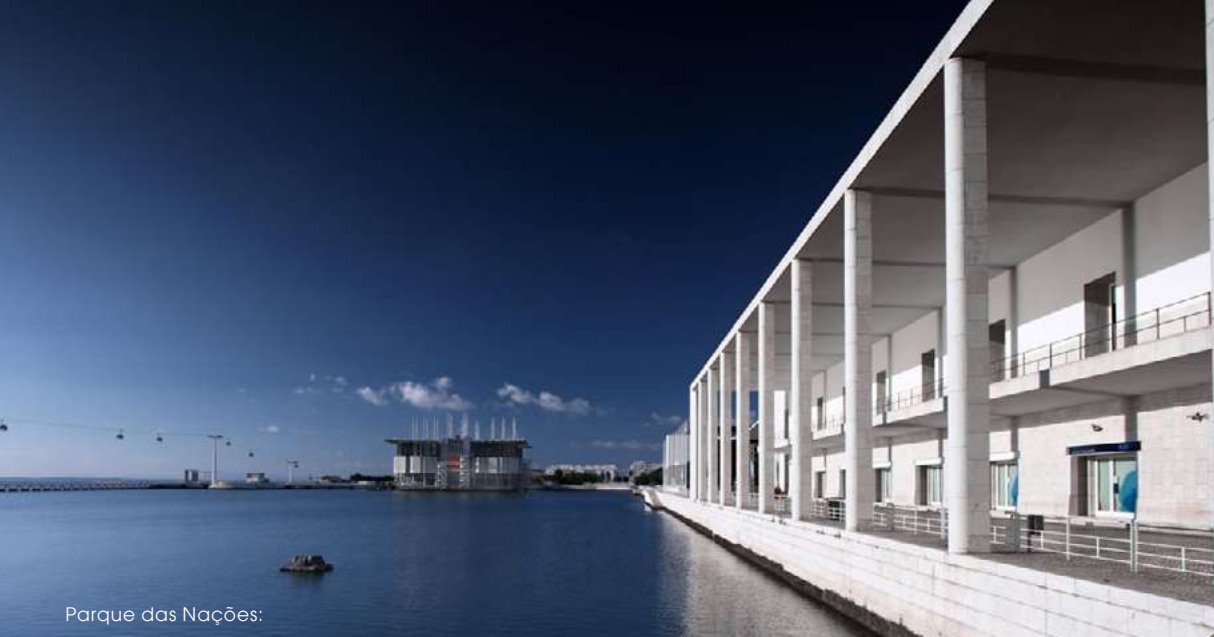
Parque das Nações: