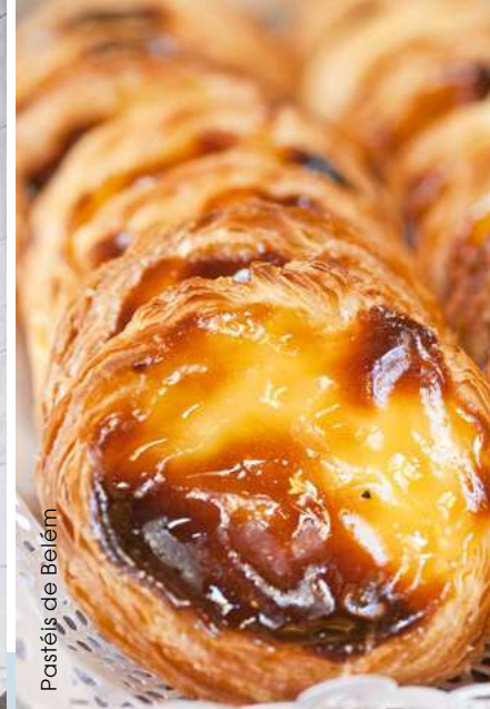
Pastéis de Belém